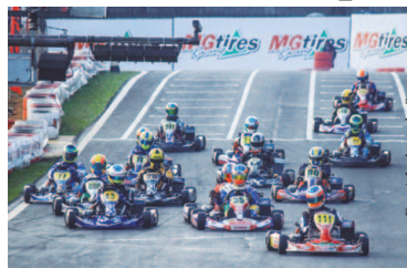
Copa São Paulo de Kart Granja Viana

A sétima etapa da Copa São Paulo KGV acontece neste final de semana no Kartódromo Granja Viana, em Cotia, na Grande São Paulo. A sexta-feira e o sábado de corridas terão diversas atrações nas 27 baterias que serão disputadas. Além da abertura do Torneio KGV, haverá também a disputa da Copa Rotax e o Rok Cup Festival, que dará duas vagas para a final mundial, que será disputada em outubro, na Itália.