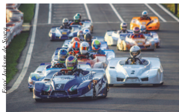
Pro-500 na última etapa da Copa SP

A sétima etapa da Copa São Paulo KGV acontece neste final de semana no Kartódromo Granja Viana, em Cotia, na Grande São Paulo. A sexta-feira e o sábado de corridas terão diversas atrações nas 27 baterias que serão disputadas. Além da abertura do Torneio KGV, haverá também a disputa da Copa Rotax e o Rok Cup Festival, que dará duas vagas para a final mundial. Página 8