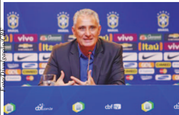
Tite está entre os 12 finalistas ao prêmio de melhor técnico do mundo

O técnico da Seleção Brasileira, Tite, está entre os 12 finalistas ao prêmio de melhor técnico do mundo em lista divulgada na quinta-feira (17) pela Fifa.