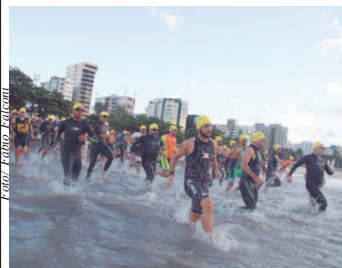
IRONMAN no Brasil

Venda de produtos de 2001 a 2016 auxiliará a Casa do Pequeno Cidadão