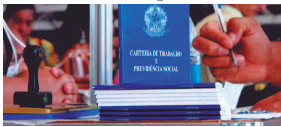
Carteira de Trabalho

País abre 35,9 mil vagas de trabalho; quarto mês com saldo positivo