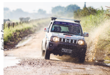
Prova reúne amigos e familiares

Nada como começar o dia em um famoso cartão postal. E os participantes do rali de regularidade Suzuki Off-Road terão este privilégio neste sábado (12), na etapa cearense da competição. A largada na Praia do Futuro, uma das mais badaladas da cidade, com seus oito quilômetros de orla e diversos quiosques com restaurantes e comida típica, recebem a largada da competição. As inscrições são gratuitas e podem ser feitas no site: www.suzuki-veiculos.com.br . Assista e conheça: https://youtu.be/d7sXLqQ9eBk