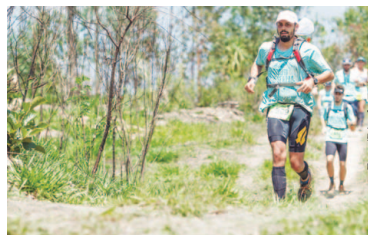
Circuito das Serras 2017

Prova será no dia 27, na Serra Caminhos do Mar. Inscrições para todas as etapas seguem abertas