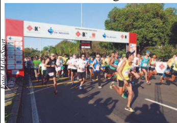
Corrida e Caminhada Contra o Câncer - Move for Cancer 2017

O Move for Cancer 2017 chegará a São Paulo neste domingo, dia 13 de agosto. A etapa paulista do movimento, alertar para os principais tipos de câncer e detecção precoce da doença, terá largada a partir das 7h do dia 13, na Assembleia Legislativa de São Paulo - Avenida Pedro Álvares Cabral, 201 -, local também da chegada após o percurso de 5 km. Depois do sucesso no Rio de Janeiro, a Corrida e Caminhada Contra o Câncer - Move for Cancer 2017 colocará os paulistas neste importante movimento.