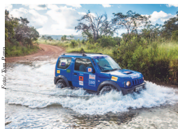
Não é necessário experiência para participar

Brasil vence a Colômbia no encerramento da fase classificatória