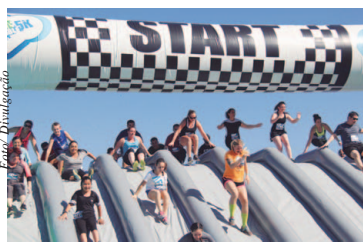
Largada da Corrida Insana