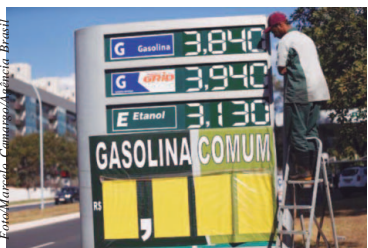
Postos de combustíveis ajustam os preços e repassam para o consumidor o aumento da alíquota do PIS e Cofins.

O reajuste nas alíquotas do Programa de Integração Social (PIS) e a Contribuição para o Financiamento da Seguridade Social (Cofins) sobre a gasolina, o diesel e o etanol já é sentido em postos de gasolina de todo país.