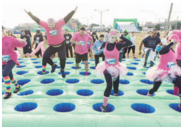
Muita diversão em 5k