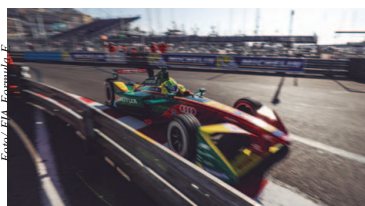
Lucas di Grassi vem de vitória no México e segundo lugar em Mônaco

Lucas di Grassi quer se manter na ascendente na sexta etapa da temporada da Fórmula E, que acontece neste sábado (20) nas ruas de Paris, exatamente uma semana após a prova de Mônaco, onde o piloto brasileiro conquistou o segundo lugar em uma batalha acirrada nas voltas finais pela vitória com o líder do campeonato Sébastien Buemi. A diferença entre ambos na bandeirada foi de apenas 0,3 segundo. Página 6