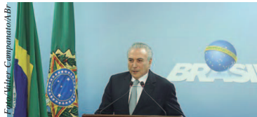
Presidente da República, Michel Temer, faz pronunciamento oficial no Palácio do Planalto

Nesta quinta-feira, o Supremo Tribunal Federal (STF) autorizou a abertura de inquérito para investigar o presidente Michel Temer. A medida foi tomada a partir de depoimentos de delação premiada dos empresários Joesley Batista e Wesley Batista, donos do grupo JBS. Página 4