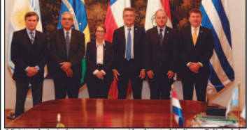
Ministros da Agricultura, estiveram reunidos durante dois dias no Palácio de La Moneda no Chile

É realmente muito importante estas reuniões do Conselho Agropecuario do Sul, porque como diz o ditado: a união faz a força. É muito mais forte um grupo do que uma pessoa sozinha. Esta pauta é relevante. Inclusive a negociação do Mercosul com a União Europeia pode ter argumentos se valorizarmos os estudos e discussões do Conselho Agropecuario do Sul (CAS). A negociação política pode sim ser influenciada com este recurso. Por hoje é só pessoal. Boa semana e um forte abraço. Até a próxima, com uma palavra chuta inteligente.