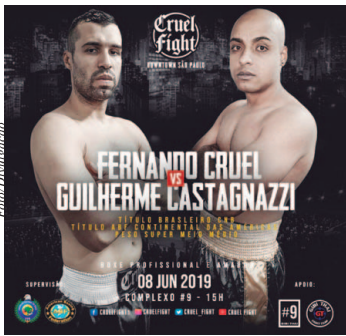
Cruel Fight Downtown São Paulo

As primeiras lutas de boxe no Brasil foram realizadas nas docas de Santos e Rio de Janeiro, entre marinheiros alemães e italianos, final do século 19 e início do século 20. O esporte se desenvolveu aos poucos no país e teve seu desenvolvimento a partir da década de 1960, com a lenda Eder Jofre e os títulos mundiais de 1961 e 1973. No século 21, a modalidade busca novos caminhos em busca de crescimento. A mais nova ação é a Cruel Fight Downtown São Paulo, dia 8 de junho, no Complexo #9, no bairro da Bela Vista, em São Paulo (SP), que irá além do card com 12 lutas. Também vai promover eventos destinados a discutir e pensar o boxe para o futuro.