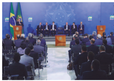
Presidente Jair Bolsonaro, ministros e parlamentares

Governo lança programa para Nordeste, Centro-Oeste e Amazônia