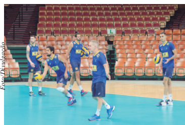
Treino do Brasil