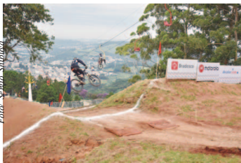
Copa América de Downhill 4X 2019

Evento será de 18 a 20 de janeiro, no Ski Mountain Park, em São Roque