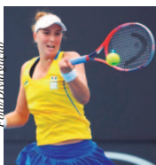
Bia Haddad Maia

"Contra a Kerber é ficar firme, manter meu jogo. Aproveitar o ritmo, já que já joguei contra uma canhota e continuar fazendo o meu jogo, não me preocupar com a minha adversária e, principalmente, acreditar em mim", afirmou a brasileira que tentará o feito inédito também de chegar à terceira rodada do Australian Open (no ano passado pela eslovena Polona Hercog).