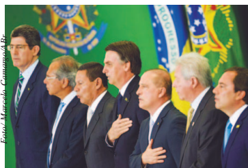
Presidente Jair Bolsonaro

Bolsonaro destacou que a escolha dos três novos presidentes de bancos foi feita exclusivamente