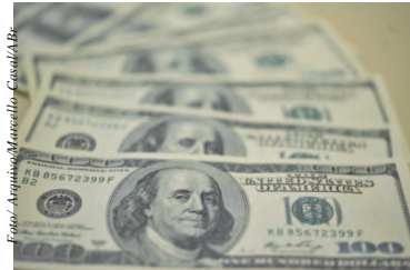
Dólar está cotado a R$ 3,70

O dólar norte-americano fechou a segunda-feira (7) com alta de 0,46%, cotado a R$ 3,7331 para venda, em um movimento de correção, após acumular três quedas seguidas. Foi a primeira alta da moeda americana neste ano.