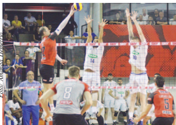
Lipe em ação

A Confederação Brasileira de Voleibol (CBV) divulgou a tabela da Copa Brasil masculina de vôlei 2019. Após o término da fase classificatória da Superliga Cimed 18/19, os oito primeiros colocados na tabela se garantiram na competição que terá a primeira fase realizada nos dias 10 e 16 de janeiro. Na Fase Final, os quatro times vencedores se reunirão em Lages (SC) para a disputa pelo título. Página 8