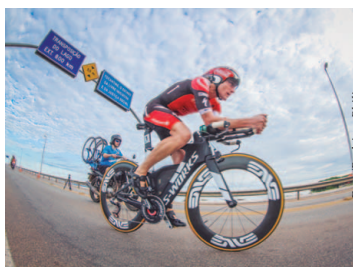
Suporte Neutro no Ironman

Presente nas principais competições do Brasil, o serviço do Suporte Neutro Shimano passou a ser feito, a partir deste ano, em parceria com a Blue Cycle (distribuidor exclusivo da Shimano no País). Junto à essa novidade, veio o aumento de cerca de 40% no número de provas e bikes atendidas. Se, em 2017, foram 24 disputas de nove competições com a presença do serviço da marca japonesa, em 2018 essa participação subiu para 34, em um total de 14 eventos esportivos. Após atender 5.100 ciclistas no ano passado, nesta temporada 7.000 bike passaram pelas mãos dos técnicos da Shimano. Página 8