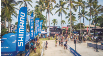
Tendas da Shimano na Vila Brasil Ride

"Foi um ano de muito trabalho, bastante corrido. Tivemos um time compacto, mas muito eficiente. Além das 34 provas atendidas, tivemos também 25 treinamentos técnicos da Shimano em todo o Brasil, ou seja, 2018 foi realmente intenso. Contamos com o apoio de vários mecânicos das lojas parceiras, as Shimano Service Center