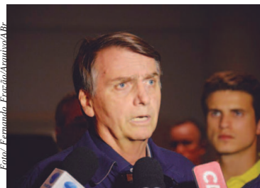
Presidente eleito, Jair Bolsonaro

Bolsonaro retorna para o Rio de Janeiro, depois de passar o feriado do Natal na Restinga da Marambaia, região litorânea do estado. A expectativa é que o presidente eleito e sua família desembarquem em Brasília no sábado (29) para se preparar para as cerimônias de posse. (Agência Brasil)