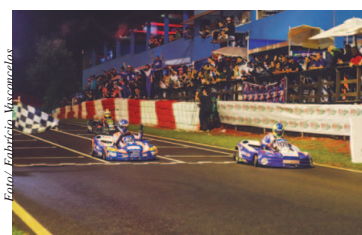
120 AM COM RACING

André Nicastro tem nove títulos brasileiros de kart, sendo o maior recordista de conquistas, mas acumulava quatro vices nas 500 Milhas da Granja Viana. Até a edição 2018, disputada no domingo no kartódromo local-