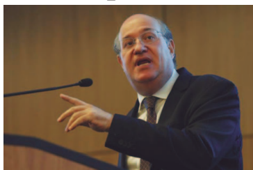
Presidente do Banco Central, Ilan Goldfajn

O presidente do Banco Central (BC), Ilan Goldfajn, disse na segunda-feira (3) que o país vive um momento de crescimento econômico - lento e gradual,