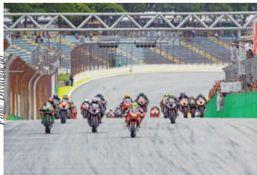
Largada Corrida 1

Corrida 1 Vitória da superação. Assim pode ser definida a primeira corrida da etapa final do SuperBike Brasil. A disputa foi eletrizante em Interlagos (SP), e contou com muitas ultrapassagens, bandeira amarela e brigas pelas posições. Alex Barros fez uma óti-