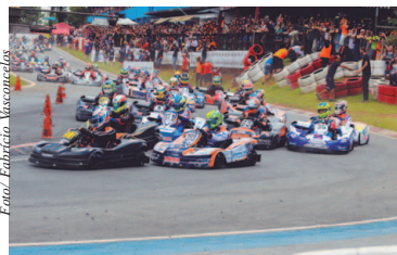
500 Milhas de Kart