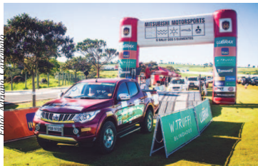
Ralis Mitsubishi chegam a Goiânia (GO) dia 18/08