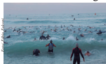
Circuito CAIXA TRIDAY Series

Ainda vivenciando o sucesso e a adrenalina do CAIXA IRONMAN 70.3 Maceté-AL, a Unlimited Sports já está pronta para mais uma estreia. Neste domingo, dia 12, Florianópolis sediará pela primeira vez uma etapa do Circuito CAIXA TRIDAY Series, competição em sua segunda temporada