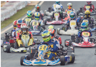
DD2 Master e DD2 terão vaga direta definida na Copa Rotax 2018

Neste sábado (11) irá acontecer a sexta e última etapa da Copa Rotax desta temporada, que está sendo realizada no Kartódromo da Granja Viana (SP). Após cinco fases de muita disputa, a competição chega ao seu final e terá a definição de três vagas diretas para o Rotax Max Challenge Grand Finals de 2018, além de contar pontos decisivos para