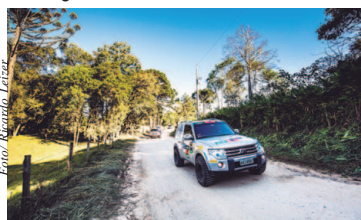
Trilhas off-road divertem os participantes, dos iniciantes aos experientes

A Mitsubishi Motors é o carro oficial e patrocinador do Rally dos Sertões há 15 anos, além de ser a maior vencedora da competição. Página 8