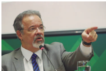
Ministro da Segurança Pública, Raul Jungmann