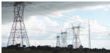
Consumo de energia

O consumo de energia elétrica demandada aos Sistema Interligado Nacional (SIN) totalizou em junho 37,791 gigawatts/hora (Gwh), volume 0,4% inferior ao do mesmo mês de 2017. Os dados constam da Resenha Mensal do Consumo de Energia Elétrica divulgada na segunda-feira (30) pela Empresa de Pesquisa Energética (EPE), que atribuiu a queda ao impacto negativo provocado pela greve dos caminhoneiros.