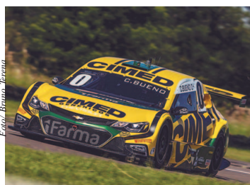
Cacá Bueno venceu em 2018 no Velopark

Vice-líder da Stock Car em 2018, Marcos Gomes é o recordista de poles largando três vezes na ponta e ainda tem três pódios na Corrida do Milhão; Cacá Bueno tem duas poles e três pódios na prova milionária, que terá sua 10ª edição neste domingo em Goiânia