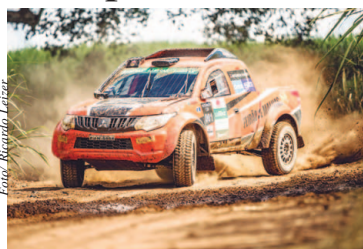
Fãs poderão acompanhar de perto a largada promocional do rali em Magda

Outra novidade será a festa de chegada dos veículos da Mitsubishi Cup em Magda na sexta-feira, dia 18 de maio. Todos os fãs de automobilismo e off-road da região poderão acompanhar de perto a largada promocional das equipes. Página 8