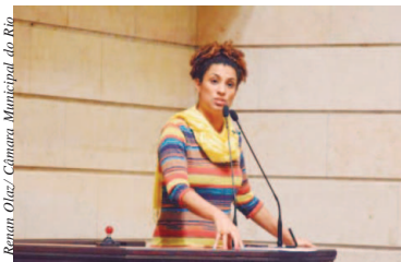
Vereadora Marielle Franco foi morta a tiros

Por meio de nota, Dodge também informou ter feito solicitação formal à Polícia Federal (PF) para que adote providências para