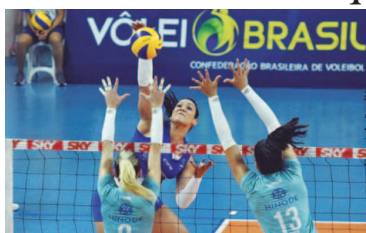
Tandara no ataque

A segunda rodada das quartas de final da Superliga Cimed feminina de vôlei 2017/2018 acontecerá na sexta-feira (16) e no sábado (17) e as oito equipes envolvidas estão em preparação intensa para a segunda chance na série melhor de três jogos. Nos primeiros confrontos, vitórias do Dentil Praia Clube (MG), Sesc RJ, Camponesa/Minas (MG) e