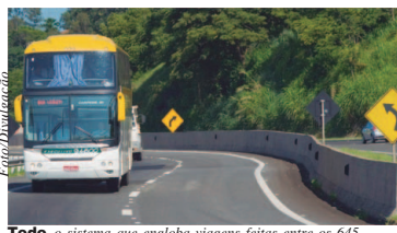
Todo o sistema que engloba viagens feitas entre os 645 municípios paulistas será reformulado e modernizado

"Nas últimas décadas muitas regiões do Estado cresceram, com novos adensamentos urbanos e novas demandas por transporte. O que a gente busca com essa concessão é adequar o transporte de passageiros à atual realidade dos milhares de paulistas que usam diariamente os ônibus regulados pela Ar-