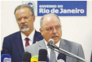
O ministro do Gabinete de Segurança Institucional da Presidência da República, general Sérgio Etchegoyen, fala após reunião no Palácio Guanabara para discutir segurança pública no Rio de Janeiro.

Eletrodomésticos A pesquisa revela ainda aumento discreto de eletrodomésticos muito usados na época do verão. Entre eles, ventilador e circular de ar (0,68%), ar-condicionado (1,67%) e geladeira e freezer (1,74%), abaixo da inflação de 3,23% medida pelo IPC-FGV. André Braz acentuou que, se a compra desses itens for à vista, o desconto pode tornar o produto ainda mais barato. (Agência Brasil)