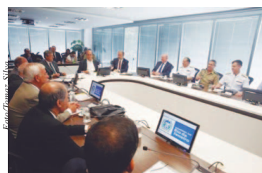
Governador do Rio, ministros e autoridades se reúnem no Palácio Guanabara para discutir segurança pública no Rio.

"Se eu desse aqui e negasse a elas, os prefeitos de outras capitais poderiam dizer: 'Quem não gosta de frevo, bom ministro não é'", disse Jungmann, ao fazer uma referência a uma frase de Crivella. O prefeito afirmou ontem que "quem não gosta de samba, bom prefeito não é".