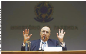
Ministro da Fazenda, Henrique Meirelles, durante coletiva sobre o rebaixamento da nota do Brasil pela agência Standard & Poor's

"O Congresso tem mostrado que tem aprovado as reformas fundamentais no país. Aprovou o teto de gastos, a reforma trabalhista, a Lei das Estatísticas e a TLP [Taxa de Longo Prazo]. Outras medidas, como o cadastro positivo e a duplicata eletrônica estão em aprovação. Existe um histórico de aprovação. Essas reformas vão continuar ocorrendo, e a perspectiva de aumento do rating é questão de tempo. Isso foi levado em conta na melhoria da perspectiva [da nota do Brasil pela S&P] de negativa para estável", destacou o ministro.