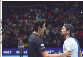
Melo e Kubot estão em primeiro no ranking mundial

leira de Tênis. Na primeira rodada, Melo e Kubot derrotaram o romeno Florin Mergea e o sérvio Nenad Zimonjic.