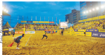
Circuito Brasileiro volta em janeiro, na etapa de Fortaleza

No naipes feminino, após três etapas, Maria Elisa e Carolina Solberg (RJ) lideram com 1.120 pontos, seguidas por Agatha/Duda (PR/SE), com 1.000 pontos. Em terceiro aparecem Ana Patrícia e Rebecca (MG/CE), com 840 pontos. E a mineira e a cearense demonstram empolgação pois jogarão em casa no retorno do tour, já que moram e treinam na capital.