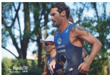
Brasileiro de Duathlon 2017

O Campeonato Brasileiro de Duathlon 2017 será a atração no mês de outubro. A Via Parque, em Alphaville, na cidade de Barueri, na Grande São Paulo, será o palco da competição, marcada para o dia 22, numa realização da CBTRI – Confederação Brasileira de Triathlon, junto à SPTRI – Federação Paulista de Triathlon. A competição será classificatória para o Mundial de Duathlon 2018 (alto rendimento e idade) e será disputada na distância Sprint (5k de corrida, 20k de