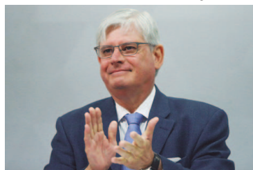
Procurador-geral da República, Rodrigo Janot