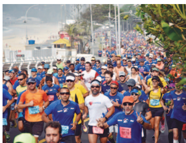
21ª Meia Maratona Internacional do Rio de Janeiro

Três grandes corridas estão marcadas para o mês que vem em São Paulo e no Rio de Janeiro