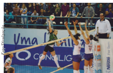
Copa São Paulo de Vôleibol Feminino 2017

A temporada 2017 do vôlei paulista, Divisão Especial, terá início no final de julho, mais precisamente nos dias 28 e 29. A Copa São Paulo Feminina 2017, tradicional torneio regional e que serve de preparação para o Campeonato Paulista da Di-