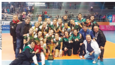
Copa São Paulo de Vôlei Feminino 2017

No ano passado, o Bauru conquistou o título da Copa São Paulo ao superar o Vôlei Nestlé por 3 sets a 2, parciais de 14/25, 25/10, 23/25 25/20 15/9, em 20h5min. O confronto foi realizado no ginásio José Liberatti e contou com a presença de um