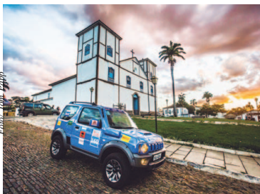
Muita diversão a bordo dos veículos Suzuki

Confira como é a prova: https://youtu.be/d7sXLq9eBK